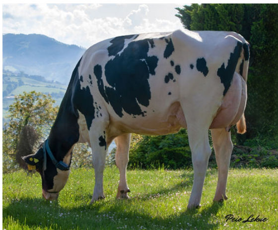
UNA JARDIN DAUGHTER

BOMAZ FASTBALL SIEMERS HUEY PARI 31034 VG-85-2YR-USA T-SPRUCE FRAZZLED HUEY SIEMERS LMDA PARIS 27856 EX-91-4YR-USA GMD DOM FARNEAR DELTA-LAMBDA SIEMERS DENVER PARIS EX-91-4YR-USA GMD DOM