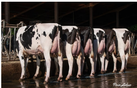
BALLGAME DAUGHTER GROUP